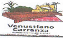
TABLA DE APLICABILIDAD MUNICIPIO DE VENUSTIANO CARRANZA, CHIAPAS.