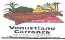
TABLA DE APLICABILIDAD NOMBRE DEL SUJETO OBLIGADO MUNICIPIO DE VENUSTIANO CARRANZA, CHIAPAS.