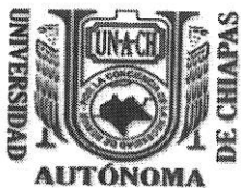
TABLA DE APLICABILIDAD, ACTUALIZACIÓN Y CONSERVACIÓN DE LA INFORMACIÓN UNIVERSIDAD AUTÓNOMA DE CHIAPAS